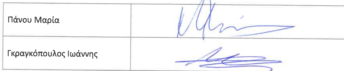
Συνημμένο 1: Πίνακας Κατάταξης & Βαθμολογίας