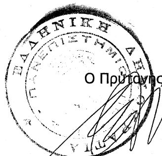
Καθηγητής Σωτήριος Καρβούνης

Πληροφορίες για τα απαιτούμενα δικαιολογητικά παρέχονται τις εργάσιμες ημέρες και ώρες για το Τμήμα Στατιστικής και Ασφαλιστικής Επιστήμης στα τηλ. 210-4142005 και 210-4142307, για το Τμήμα Χρηματοοικονομικής και Τραπεζικής Διοικητικής στο τηλ. 210-4142183 και για το Τμήμα Ναυτιλιακών Σπουδών στα τηλ. 210-4142525 και 210-4142526.