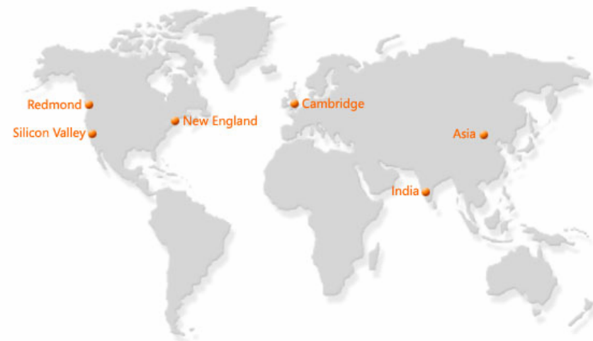
Microsoft Research Worldwide Labs