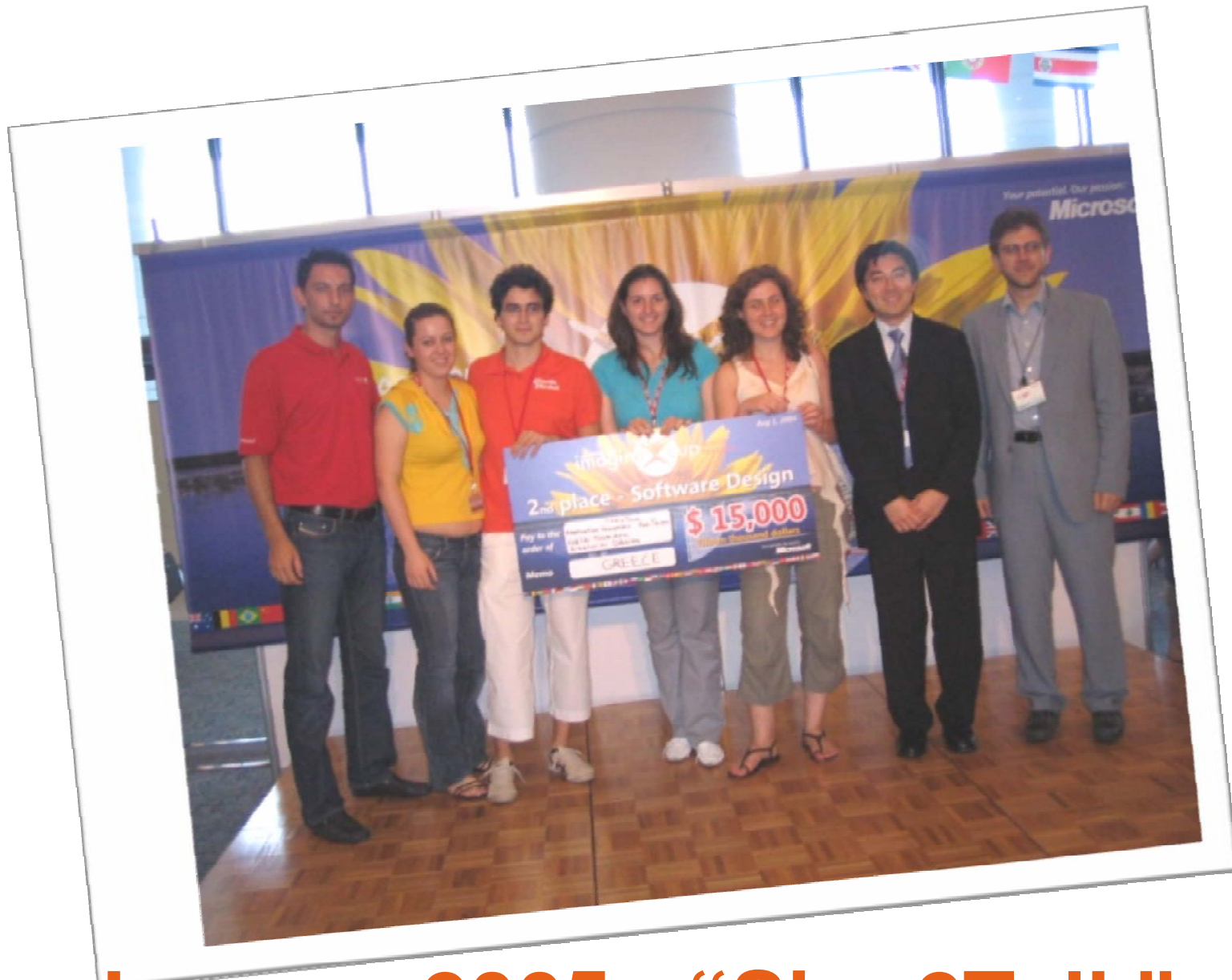
Japan – 2005 - “Sign2Talk”