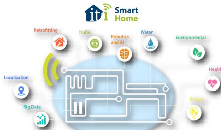
Οικοσύστημα τεχνολογιών και υπηρεσιών στο «Έξυπνο Σπίτι» του ΕΚΕΤΑ/ΙΠΤΗΛ

Το σχεδόν μηδενικής κατανάλωσης (near Zero Energy Building – nZEB) «Έξυπνο Σπίτι» του ΕΚΕΤΑ/ΙΠΤΗΛ είναι μια υποδομή που εξομοιώνει ένα πραγματικό οικιακό κτήριο προσφέροντας υπηρεσίες γρήγορης πρωτοτυποποίησης και επίδειξης καινοτόμων τεχνολογιών, σε διάφορους