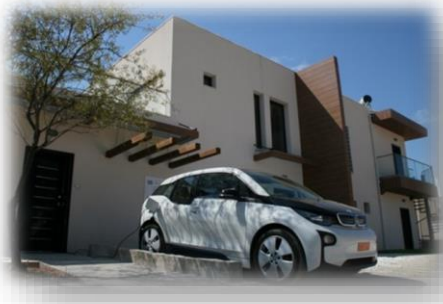
Το «Εξύπνο Σπίτι» του ΕΚΕΤΑ/ΙΠΤΗΛ

Αμαλία Δρόσου – Υπηρεσίες εξωστρέφειας και δικτύωσης ΕΚΕΤΑ / Τηλ.: 2310 498214 / e-mail: amelidr@certh.gr